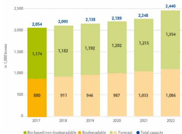
Figur 1. Global produktion av biobaserade och bionedbrytbara plaster. (European Biobaserad plastics, 2017).

Det är långt ifrån självklart att produkter som marknadsförs som biobaserade är det till fullo, till exempel består biobaserad PET av 20-30 procent biomassa 13 och resten fossilbaserad råvara. Den här typen av plaster kallas drop-in plaster. De är identiska med den motsvarande fossilbaserade plasten och har liknande kemiska och fysikaliska egenskaper. För några av de mest använda plastsorterna (Hög-densitet polyeten (HDPE), låg-densitets polyeten (LDPE), polyuretan (PUR) och Polyetentereftalat (PET)) finns det idag fullgoda biobaserade drop-in plaster, för HDPE och LDPE är det möjligt att använda upp till 100 procent biobaserad råvara.